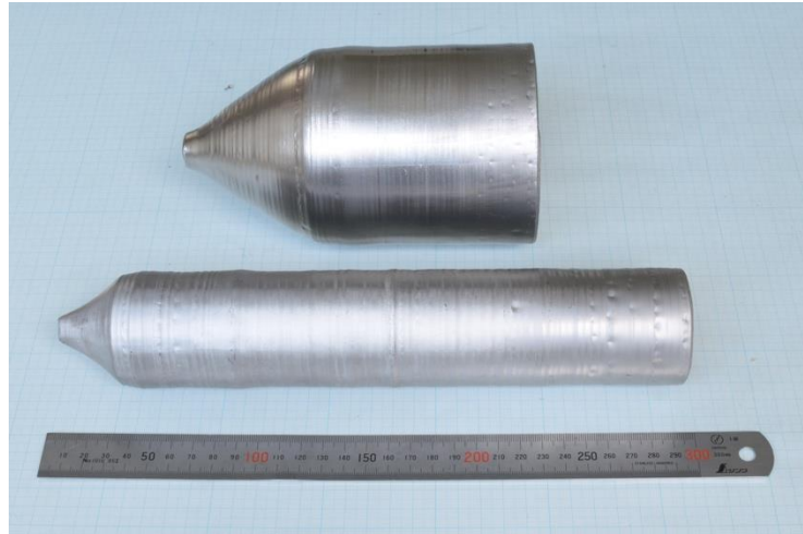
写真 1:手前が直径2インチ直胴 25 センチ、奥が直径 4 インチ直胴 10 センチの Fe-Ga 単結晶インゴット(*6)

なお、本研究は、科学技術振興機構(JST)の戦略的創造研究推進事業チーム型研究(CREST)「微小エネルギーを利用した革新的な環境発電技術の創出(研究統括:谷口研二(大阪大学 名誉教授))」の研究課題「磁歪式振動発電の実用化に向けた革新的メカニズム・材料の創成(代表研究者:上野 敏幸(金沢大学))」と東北大学出資事業BIP(ビジネスインキュベーションプログラム)の支援を受けて行われました。